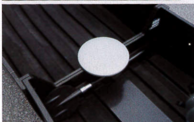
上:シャフトの中央にあるリリースノブ1個で、着脱とアームの向きを変えられます。タイヤには「6 1/2 ~3 TAIWAN GIFU SANKENKOGYO」と刻印されていました