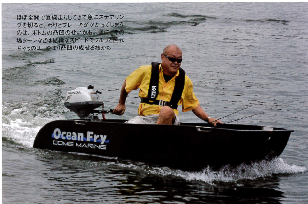
ほぼ全開で直線走りてきて急にステアリングを切ると、わりとブレーキがかかってしまうのは、ボトム凸凹のせいかも。逆に、この場合ターンなどは結構なスピードでクルッと回れちゃうのは、やはり凸凹の成せる技かも