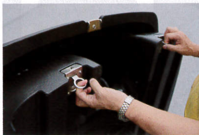
折り畳む際には、このクラッチ2個がロックになります

ただ。しかし、童夢の子会社である「カーボンマジック」などは、私が見るところ、わが国で最高レベルのカーボンファイバーの扱い手だと思う。