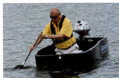
バドリングの実際。ブレード込みで930mmの長さでは、少々短い気がしました。ブレードの有効性はともかく、デザインはなかなか凝っていますよ