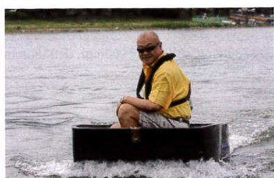
こういうのをミズスマシというのでしょうか。外見もですが、私では重た過ぎて、水を押しつけて走っています。でも、左右前後の安定感は秀逸です