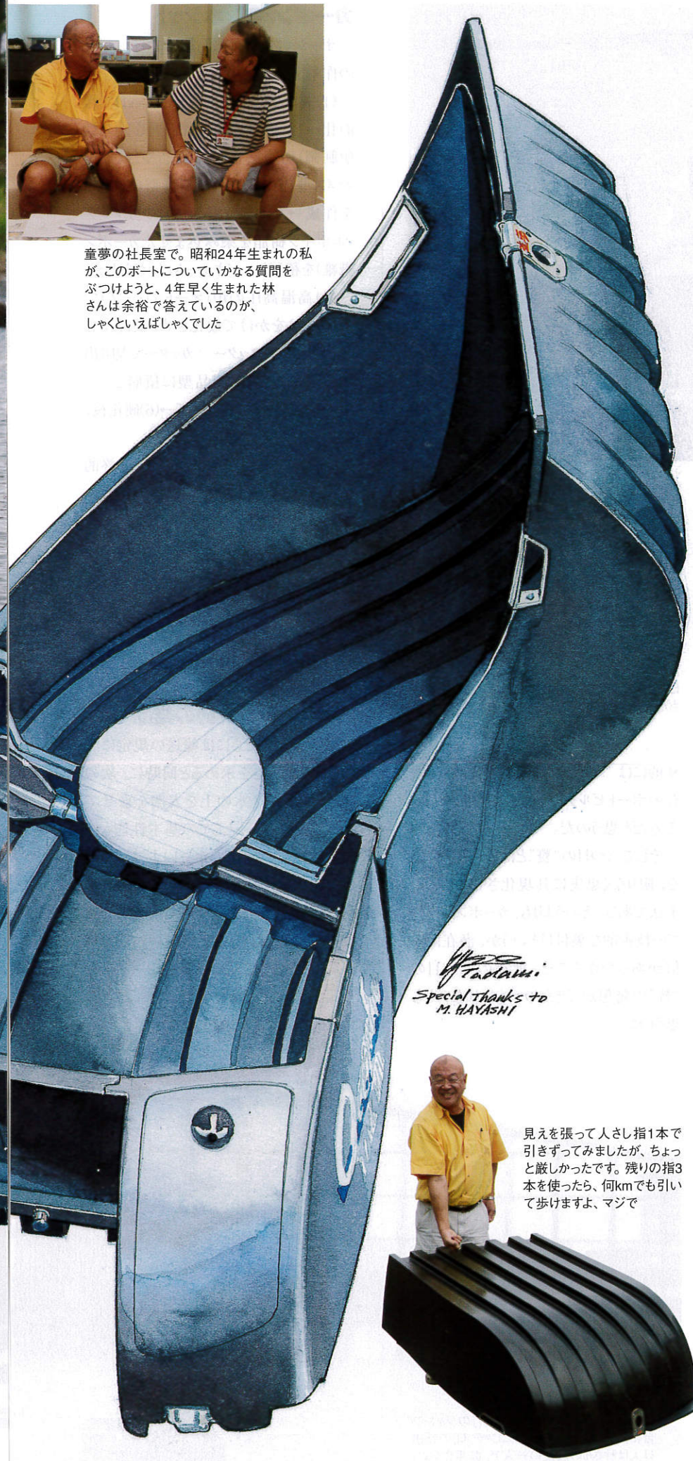
下:船外機をフォールディングしたところ。船外機が収まる部分には、幅230mm×長さ600mmのカーボンの板が張られています。この後部ハルの内側は、長さ730mmで、幅はおよそ900mm、深さ383mmというサイズです