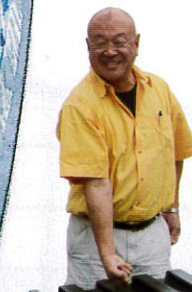
見えを張って人さし指1本で引きずってみましたが、ちょっと厳しかったです。残りの指3本を使ったら、何kmでも引いて歩けますよ、マジで

すのかを説明しよう。今回紹介する「オーシャンフライ」が誕生したきっかけと、それが実際に水に浮かぶまでの過程を眺めていて、このボートこそ良い意味で、そしてわが国では目にすることがなかった“王道的ヨット”なのではなかろうかと思えてきたからである。